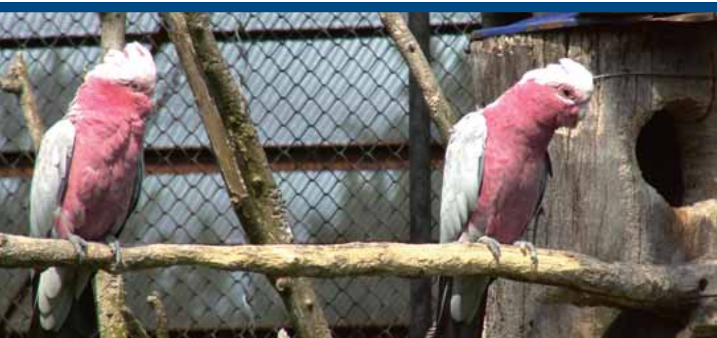
rózsás kakaduk ( Eolophus roseicapillus )

A hazai jogrend új eleme a közelmúltban megjelent 41/2010. (II. 26.) Korm. rendelet a kedvtelésből tartott állatok tartásáról és forgalmazásáról. Az állatok védelméről és kíméletéről szóló 1998. évi XXVIII. törvény alapszabályaihoz hasonlatos megállapítások mellett a rendelet további általános alapelveket is rögzít. A továbbiakban a rendelet azon főbb szabályait emeljük ki, melyek érintik az egzotikus állatokkal foglalkozókat.