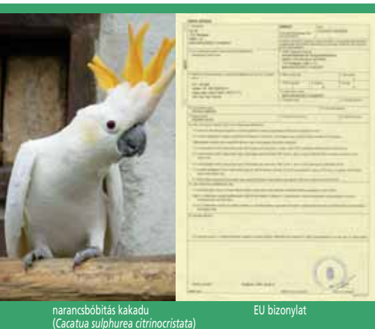
narancsbóbitás kakadu ( Cacatua sulphurea citrinocristata )

A szabályozás magára a kereskedelmi tevékenységre, azaz – többek között – a vételre vonatkozik, ezért a Magyarországon vagy a más EU tagállamban történő vásárlásra ugyanazok a szabályok érvényesek. Az EU-ban „A” mellékletes állat csak EU bizonylattal árusítható. Így, ha Ön „A” mellékletes állatot szeretne vásárolni, csak akkor tegye meg, ha EU-s bizonylattal (sárga színű) árulják.