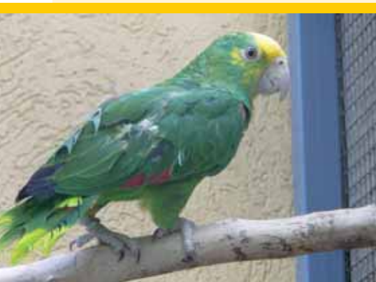
zárt lábgyűrűs sárgahomlokú amazon ( Amazona ochrocephala )

Amennyiben az állat fizikai vagy magatartásbeli tulajdonságai miatt nem alkalmazható a zárt gyűrű, kérelemre a természetvédelmi hatóság engedélyezhet más jelölési módszert is. Ekkor írásos kérelemben kell a felügyelőséghez fordulnia.