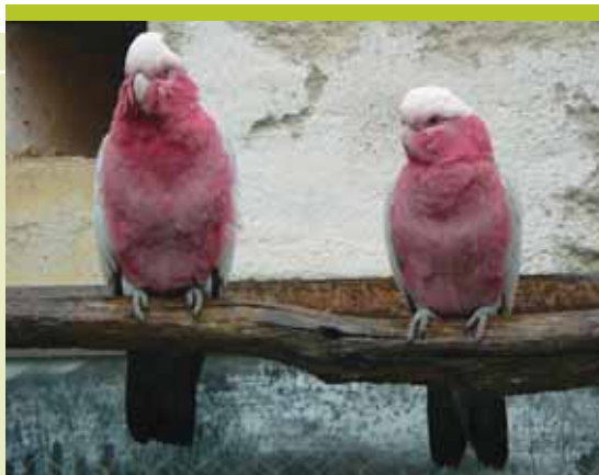
rózsás kakadu ( Eolophus roseicapillus )