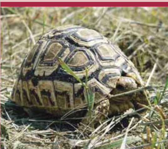
párducteknős ( Stigmochelys pardalis )

*Az eredetileg a Washingtoni Egyezmény III. függelékén szereplő fajok esetén,