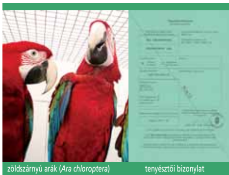
zöldszárnú arák ( Ara chloroptera )