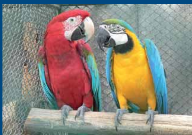
zöldszárnyú ara ( Ara chloroptera ) és kék-sárga ara ( Ara ararauna )