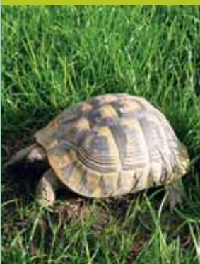
görög teknős ( Testudo hermanni )

Ez azt jelenti, hogy ha Ön egy „A” mellékletes állatát (pl. egy görög teknőst vagy egy sárgabóbitás kakadut) egy börzére elszállítja és azokat bemutatja, EU bizonylattal kell rendelkeznie tekintet nélkül arra, hogy végül valóban eladja-e állatát vagy sem.