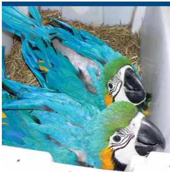
kék-sárga ara fiókák ( Ara ararauna )

A kérelmen kérjük feltüntetni: átutalási megbízás esetén az érkeztetés időpontját, csekken történő befizetés esetén a csekk azonosító számát (a feladóvevény alsó, fehér sávjában található szám).