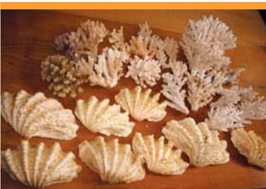
lefoglalt kókorallok ( Scleractinia sp.) és óriáskagylók ( Tridacna sp.)

4.1. EXPORTRÓL akkor beszélünk, ha a kívüni szánt állat az EU-ból (Magyarországról vagy más EU tagállamból) származik. A származást dokumentummal kell igazolni, amelyet csatolnia kell kérelme mellé. Arról, hogy az egyes esetekben milyen dokumentumok szükségesek a származás igazolására, az alábbiakban adunk tájékoztatást.