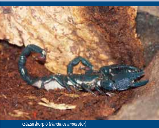
császárszcorprió ( Pandinus imperator )

Az egyezmény alapján fogságban szaporított állatnak („C” – Captive bred) kizárólag az minősül, amelynek tenyészállománya maga hozott létre ellenőrzött környezetben második vagy további generációs utódot, vagy azt olyan módon kezelik, ami bizonyítottan képes ellenőrzött környezetben második generációs utódok megbízható létrehozására.