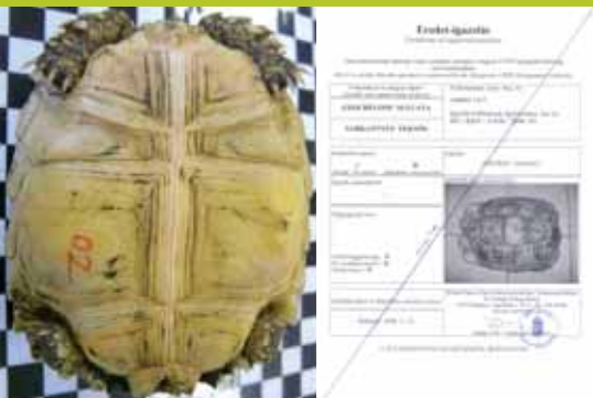
sarkantyús teknős ( Geochelona sulcata )

Az eladást az azt követő 30 napon belül díszállatok esetén a területileg illetékes felügyelőséghez (soly-másmadar esetén a Közép-Duna-völgyi KTVF-hez, egyéb fokozottan védett állatfaj esetében a Fő-felügyelőséghez) be kell jelenteni. A Tulajdonos-változást bejelentő lapot a www.cites.hu honlapon töltheti le, a füzet hátoldalán megtalálja a felügyelőségek elérhetőségét. A bejelentő lapon fel kell tüntetnie az Ön (előző tulajdonos), valamint az új tulajdonos, az eladott állat, illetve az átadott dokumentum adatait.