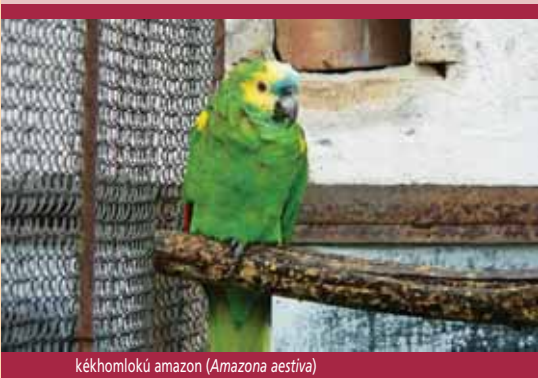
kékhomlokú amazon ( Amazona aestiva )

A kérelemhez csatolja a(z) (re-)export engedély másolatát is. A kérelmet az ügyintézés gyorsítása érdekében elküldheti faxon vagy e-mailen is. Ettől függetlenül a kérelem csak aláírással és keltezéssel érvényes, ezért az eredeti példányt is be kell nyújtania a hatóságnak. Az eljárásért igazgatási szolgáltatási díjat kell fizetni (Lásd 20. oldal) Az ügyintézési határidő 22 munkanap, ezért célszerű, ha megtervezi a behozatalt, és jó előre