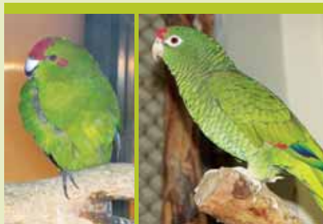
piroshomlokú kecskepapa (Cyanoramphus novaeseelandiae)

Ha Ön „A mellékletes” állatát el akarja adni, vagy akár egy börzén kívánja kiállítani görög teknős, mór teknős és szegélyes teknős esetében a területileg illetékes felügyelőségtől, minden más állatfaj esetén a magyar CITES Igazgatási Hatóságtól kérelmeznie kell a származást igazoló EU-s bizonylatot.