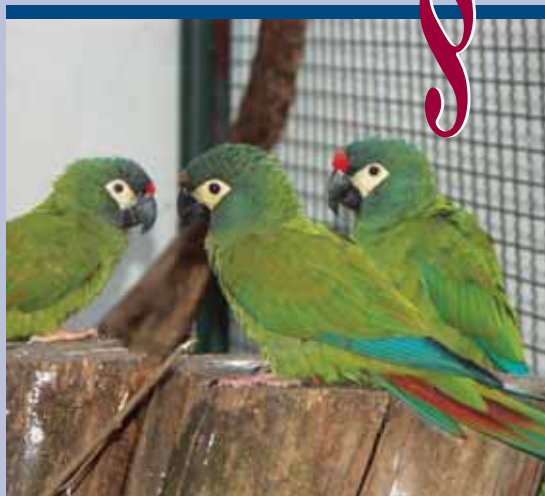
vöröshátú törpearák ( Propyrrhura maracana )

A felsorolt jogszabályok hatályos szövegét megtalálhatja a www.cites.hu honlapon.