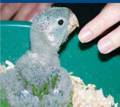
kéznel nevelt pávua papagájfióka ( Aratinga wagleri )

PASSERIFORMES ..... Verébalakúak Fringillidae ..... Pintyfélék Carduelis cucullata ..... Tűzcsíz