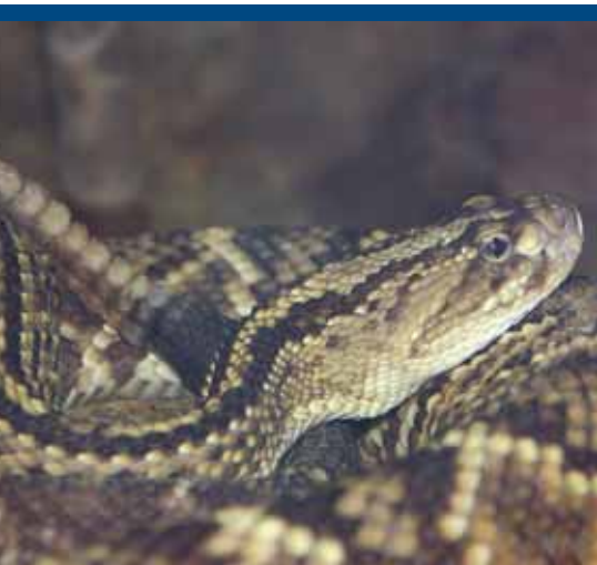
borzasztó csörgőkígyó ( Crotalus durissus )

A Washingtoni Egyezmény (CITES) kapcsolatos engedélyek, bizonylatok kiállítása igazgatási szolgáltatási díjköteles eljárás – a környezetvédelmi, természetvédelmi, valamint a vízügyi hatósági eljárások igazgatási szolgáltatási díjairól szóló 33/2005. (XII. 27.) KvVM rendelet alapján.