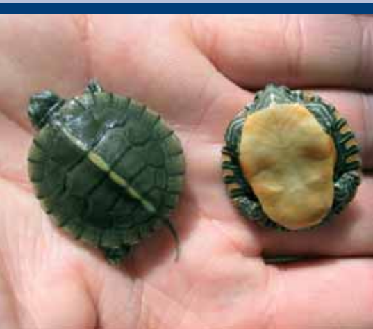
díszes ékszerteknős ( Chrysemys picta )