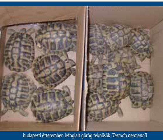
budapesti étteremben lefoglalt görög teknősök ( Testudo hermanni )

A vadon élő állatokkal folytatott kereskedelem útvonala főként a fejlődő dél-amerikai, afrikai és dél-kelet ázsiai országok felől a világ gazdasági nagyhatalmai, tehát elsősorban az Európai Unió, Japán és az Amerikai Egyesült Államok felé irányul.