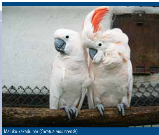
Maluku-kakadu pár ( Cacatua moluccensis )

Ezen a függeléken olyan fajok szerepelnek, melyeknek egy adott országban élő állománya veszélyeztetett, de a helyi természetvédelem nem elég erős ahhoz, hogy a kereskedelem káros hatásaitól megvédje. Ezért ehhez nemzetközi segítséget igényel.