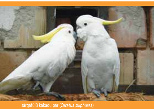
sárgafülű kakadu pár ( Cacatua sulphurea )

A Washingtoni Egyezmény I. függelékén szereplő fajok vadon fogott példányainak exportja, illetve re-exportja esetén a fogadó ország hatósága által előzetesen kiállított import engedély is szükséges. Ez esetben a fogadó ország nyilatkozik arról, hogy helyt ad-e az importnak. Ennek megléte esetén