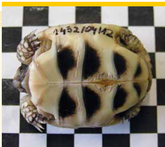
szegélyes teknős haspáncélfotó ( Testudo marginata )

Tekintve, hogy a fiatal, kis méretű teknősökbe ennek behelyezése sérüléseket okozhat, 10 cm-es páncélhossz eléréséig fényképes azonosítást lehet kérelmezni. Az erre vonatkozó kérelmet a felügyelőségeknek kell benyújtani, akik elvégzik a digitális fénykép elkészítését az állatról. A fénykép az állathoz kiadott dokumentumra (tenyésztői bizonylatra vagy EU bizonylatra) kerül. A fotózást fél-évente újra el kell végezteni mindaddig, amíg a teknős el nem éri a 10 cm-es páncélhosszt. Ekkor az állatot microchippelel kell megjelölni.